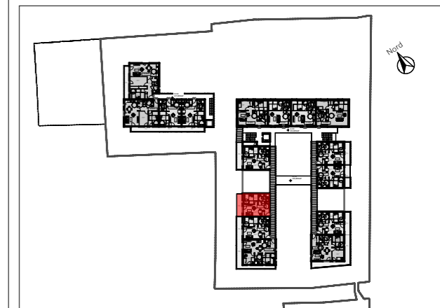
APPARTEMENT C202 - T2 2ème étage

Résidence Séniors 1-5 rue Albert Lépée Saint-Pierre-en-Auge